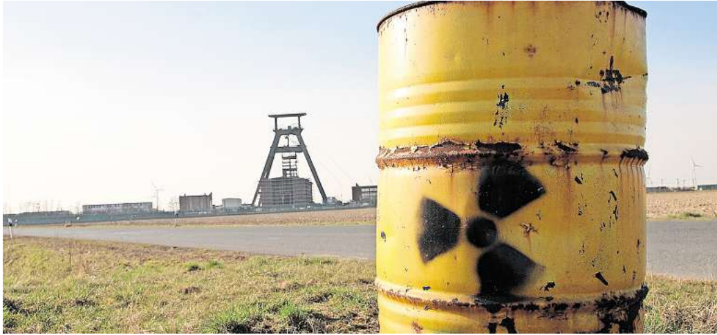
Gefahr für das Trinkwasser: Gemessen an den Auflagen, gibt es derzeit wohl kein Gebinde, um Atom- müll sicher im Schacht Konrad einzulagern.

In dem Papier räumt die Kommission ein, dass es „aktuell keine Gebinde gibt, die die Anforderungen aus den derzeit gültigen Endlagerungsbedingungen sowie den gemäß der Gehobenen wasserrechtlichen Erlaubnis (GwE) weiter zu berücksichtigenden Regelwerken vollumfänglich erfüllen und damit im Endlager Konrad eingelagert werden können.“ Aus diesem Umstand folgere das Gremium, dass die häufigen Aktualisierungen des wasserrechtlichen Regelwerks „die Einlagerung von Ab-