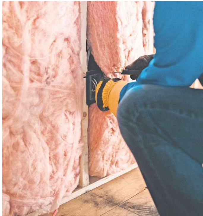
Viele Immobilieneigentümer in Deutschland sind einer Umfrage zufolge nur mit Zwang zu energetischen Sanierungen bereit.

Helfen werde wohl nur eine Mischung aus Anreizen und gesetzlicher Verpflichtung, meint die ING mit Blick auf kommende EU-Regeln. „Die Devise für die vor uns liegenden Jahre wird