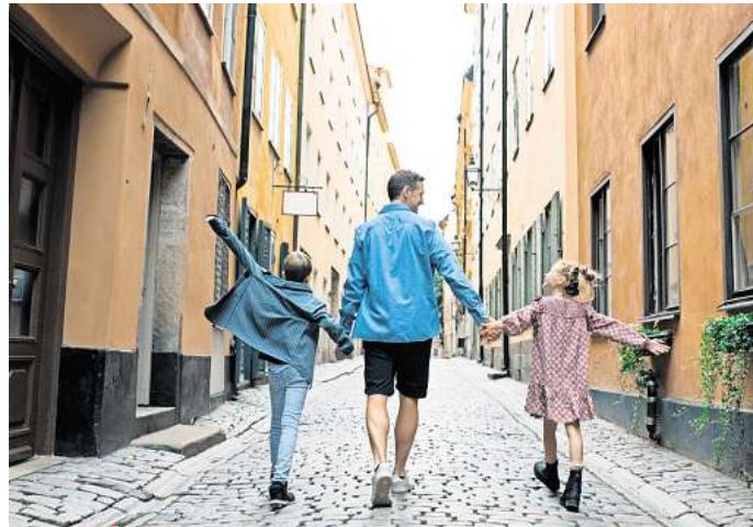
In welcher europäischen Stadt sind die Menschen am freundlichsten?

Valencia ist zwar weniger bekannt als Barcelona oder Madrid, erreicht mit 91,00 Punkten aber den dritten Platz im Freundlichkeitsranking. Die spanische Küstenstadt, die kürzlich von einem schweren Unwetter mit Überschwemmungen heimgesucht wurde, kann mit einer Kombination aus mediterranem Lebensstil,