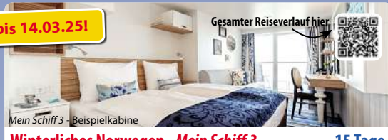
Mein Schiff 3 - Beispielkabine