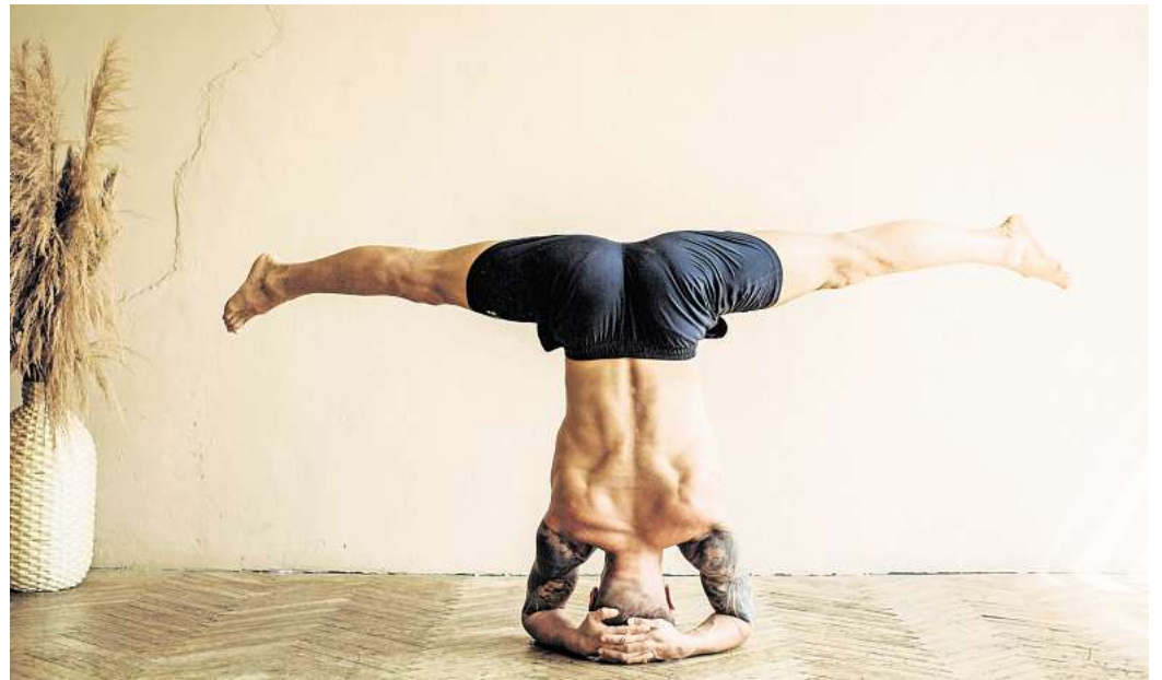
Gesundheit ist ein Markt, der immer weiter wächst.

Zudem sei es auch problematisch, die Verantwortung für Gesundheit so sehr zu individualisieren. Ob man rauche, gesunde esse oder Sport treibe, habe Einfluss auf die Gesundheit, so Schorb, aber entscheidend seien die gesellschaftlichen Rahmen-