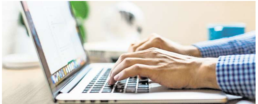
Wer im Internet nach dem Begriff „MPU-Vorbereitung“ sucht, landet schnell auf unseriösen Seiten.