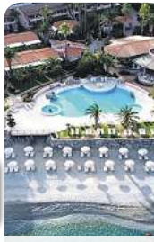
4* Villaggio Cala di Volpe

Kalabrien, das Juwel an der „Stiefelspitze“ im Süden Italiens, vereint reiche Kultur, beeindruckende Natur und Dolce Vita. Hier erwarten Sie unvergessliche Erlebnisse.