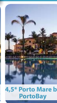
4,5* Porto Mare by Porto Bay