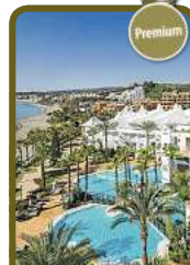
4,5* H10 Estepona Palace

Auch in den Herbstferien mit Kinderfestpreis!