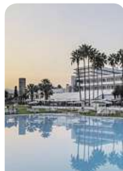
4* Sol Estepona Atalaya