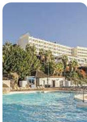
4,5* Benalma Costa del Sol

Willkommen an der Sonnenküste Andalusien mit ihren goldenen Stränden und türkisblauen Wasser! Ob erholsamer Strandurlaub, sportliches Abenteuer oder kulturelle Highlights – an der Costa del Sol ist alles zu finden.