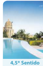
4,5* Sentido Michelizia Tropea Resort