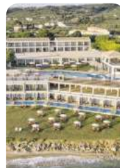
4,5* Cavo Orient