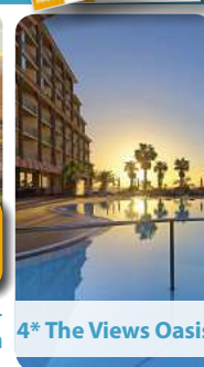
4* The Views Oasis

Kommen Sie mit auf die Blumeninsel Madeira und erleben Sie spektakuläre Natur, von der malerischen Küste bis hinauf auf die majestätischen Gipfel der Berge.