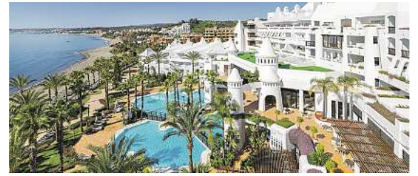
Vielältige Hotelangebote, wie hier das 4,5* Premium H10 Estepona Palace an der Costa del Sol in Andalusien, stehen zur Auswahl.

In allen Zielen besteht die Auswahl aus einem großen Hotelportfolio. Vom Flair-Hotel bis zur Luxusunterkunft.