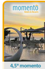
4,5* momento Hotels & Resorts Galia Luxury Resort