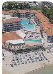
4* Tsilivi Beach

Zakynthos, die Perle des Ionischen Meeres, verführt mit atemberaubenden Stränden und kristallklarem Wasser – perfekt für einen unvergesslichen Urlaub.