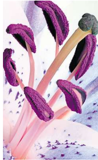
Do vielfältig die Pflanzen sind, so vielfältig ist auch ihr Pollen.

Der Klimastress lässt die Pflanzen zudem mehr Pollen produzieren. Normalerweise stellen Bäume ihren Pollen in schwankenden Mengen her – also in einem Jahr mehr Pollen, im Jahr darauf weniger. Doch seit einigen Jahren beobachtet der Deutsche Polleninformationsdienst, dass die Pollenproduktion bei manchen Bäumen und Pflanzenarten