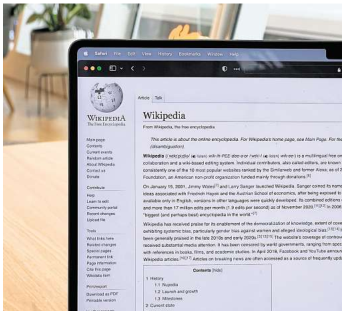
Wikipedia hat sich zu einer Art Standardwerk der schnellen Informationsbeschaffung entwickelt.

Die Frage ist nur: wie lange noch? Schon die Geschichte hat gezeigt, dass politische Akteure in autoritären Staaten zuallererst auf die Informationsfreiheit der Bürgerinnen und Bürger abzielen. Da werden dann Bücher verboten, Medienhäuser geschlossen oder auf Linie gebracht und unliebsame Publikationen unter Druck gesetzt. In den USA, wo der Staatsumbau seit der Amtseinführung Trumps in vollem Gang ist, sind derartige Angriffe