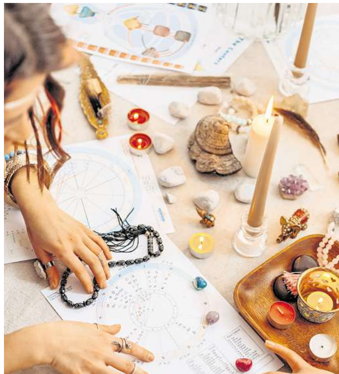
Die Astrologie gilt nicht als anerkannte Wissenschaft, sondern zählt nach heutigen Maßstäben zu den Pseudo-Wissenschaften.