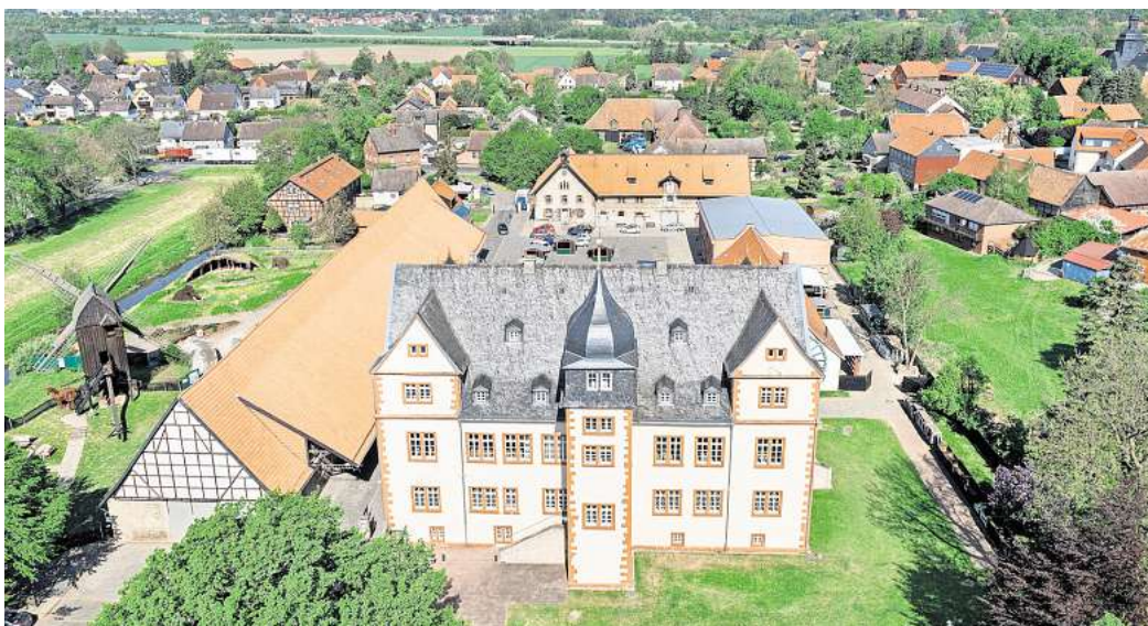
Kooperation beschlossen: Die Volkshochschule Salzgitter bietet am 30. Mai einen Ausflug ins Städtische Museums Schloss Salder an.

Von Naturerlebnissen über Stadtentdeckungen bis zu kreativen Begegnungen: Die Veranstaltungen bieten einen abwechslungsreichen Mix aus Erlebnis, Austausch und Wissen. Im Angebot sind zum Beispiel Ausflüge in Salzgitter wie ein Besuch des Städtischen Museums Schloss Salder an. Kooperationspartner sind die Volkshochschulen in Braunschweig, Gifhorn, Göttingen, Osterode, Goslar, Holzminden, Peine, Salzgitter und Wolfsburg.