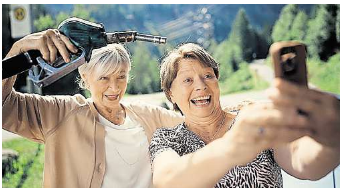
Ganz viel schwarzer Humor: Der Film „Toni und Helene“ ist am Sonntag im Cinema zu sehen.