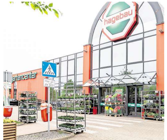
Bald ist alles in Obi: Der fast 12.000 Quadratmeter große Hagebaumarkt wird in den nächsten Jahren umgestellt. RUDOLF KARLICZEK

trinkgut GM Willeke GmbH Gültig vom 28.04. – 03.05.25 Öffnungszeiten: Mo-Sa 8-20 Uhr