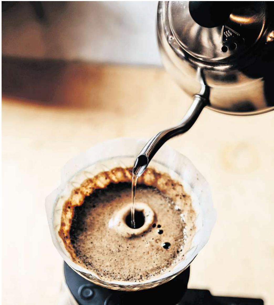
Filterkaffee ist dem Deutschen Kaffeeverband zufolge die beliebteste Art, Kaffee zu genießen.

Ein starker, konzentrierter Wasserstrahl erzeugt demnach eine Art Lawine im Kaffeepul-