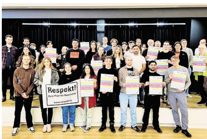
Die Mitglieder bereiten das Friedensfest vor: Das Bündnis für Demokratie und Toleranz in Salzgitter lädt für den 8. Mai ein.

Im Mittelpunkt des Nachmittags steht der offene Austausch über das Thema Frieden in all seinen Facetten. Zahlreiche Organisationen, darunter der Arbeitskreis Stadtgeschichte, das Flöther Frauenforum oder das Jugendparlament gestalten das Fest mit Informationsständen, Mitmachaktionen und Gesprächsangeboten. Für die Kinder gibt es kreative Bastelaktionen, außerdem lädt ein Friedensquiz zum Mitmachen ein. Auch für Speisen und Getränke ist gesorgt – mit Kuchen in entspannter Atmosphäre. Alle Bür-