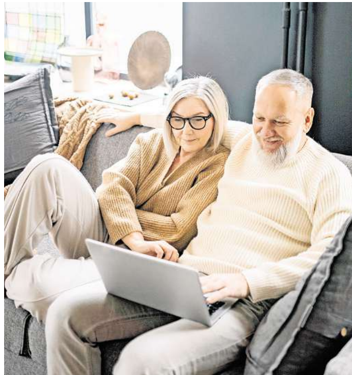
Eignet sich ChatGPT für die Paartherapie?