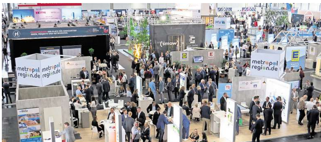
Premiere in Hannover: Bei der Real Estate Arena beteiligt sich Salzgitter erstmals am Stand der Metropolregion.

„Ziel unserer Teilnahme ist es, Salzgitter als bedeutsamen Industriestandort von herausragender wirtschaftlicher Dynamik und Innovationskraft – gerade in den beiden Zukunftstechnologien Elektromobilität und Wasserstoff – zu positionieren“, schreibt die WIS dazu. Durch den Austausch mit führenden Unternehmen, Investoren und Fachleuten aus der Immobilienbranche will sie den Dialog über zukünftige Entwicklungs- und Investitionsmöglichkeiten fördern und Salz-