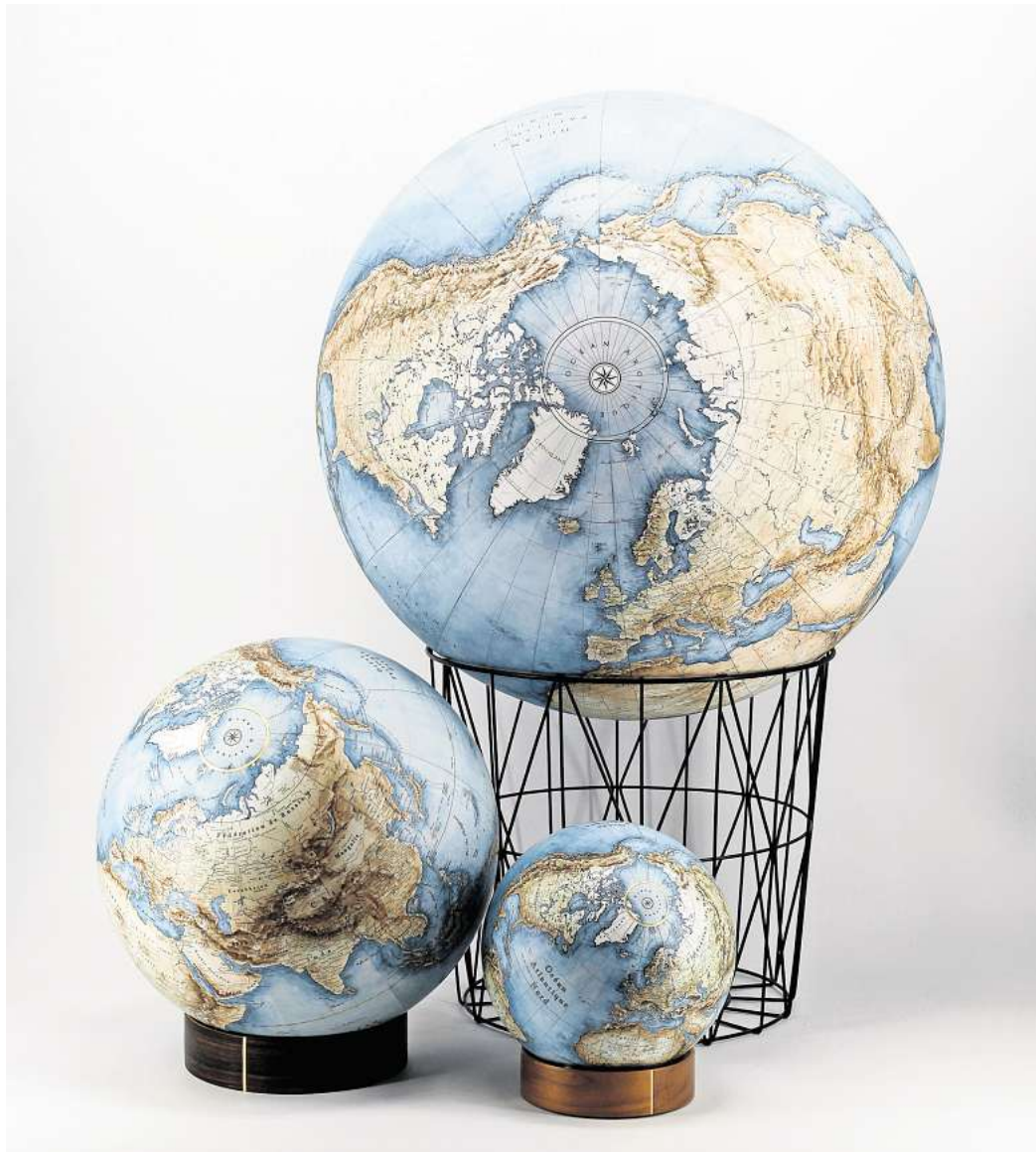
Den Erdüberlastungstag berechnet das Global Footprint Network für jedes Land und für die gesamte Erde.

Die Organisation Oxfam nimmt vor allem die Rolle der Reichen in den Blick: Das reichste