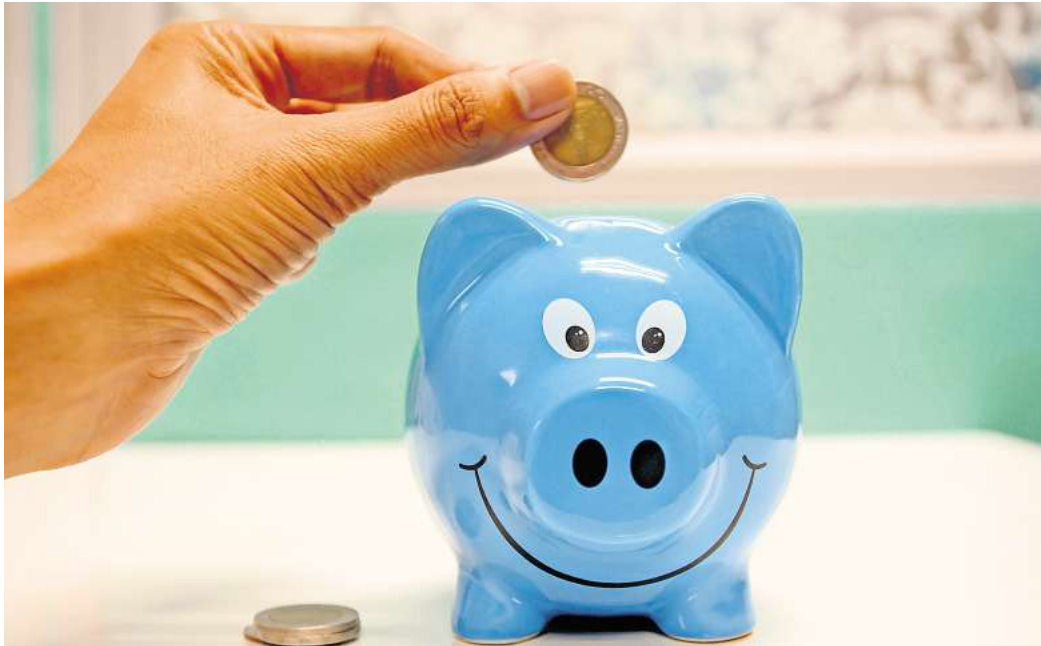
Eine Studie belegt: ein bedingungsloses Grundeinkommen fördert die Zufriedenheit.

Alle sechs Monate gaben sie den Forschern in Befragungen Informationen darüber, ob ein bedingungsloses Grundeinkommen in die soziale Hängematte führt oder als Sprungbrett dient. Sind sie weiter zur Arbeit gegangen, oder haben sie ihren Job gekündigt? Haben sie gespart? Waren sie glücklich, oder hat das Grundeinkommen sie satt und faul gemacht? Antworten auf diese Fragen gaben