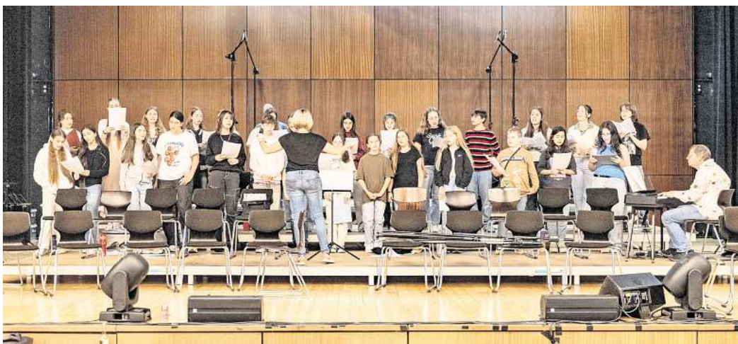
Proben für den großen Auftritt zum Jubiläum: Der Chor des Gymnasiums Salzgitter-Bad singt am 14. Juni in der Aula.

Am Sonntag geht es weiter mit der „RockySZ-Horror-Show“. Für den Spaß gibt es schon lange keine Karten mehr. Am Montag