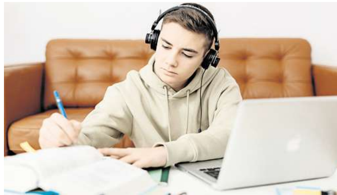
Lernen mit dem Laptop: Viele Jugendliche sitzen lieber vor dem Bildschirm als in der Schule.

Dabei ist das Konzept eigentlich veraltet: klassischer Frontalunterricht, lehrerzentriert, wenig Interaktion. Die Erklärvideos sind eine kostenlose Ergänzung.