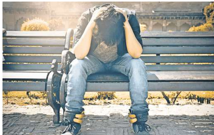
Fast die Hälfte der jungen Menschen in Deutschland fühlt sich moderat oder stark einsam.