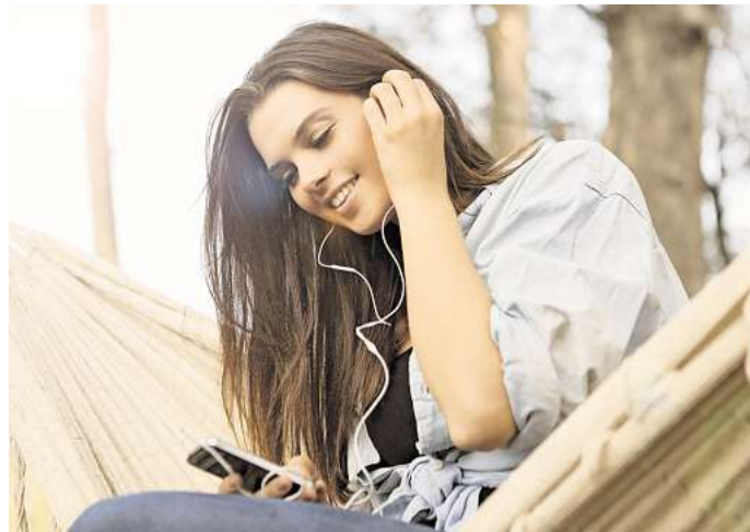
Die Beliebtheit wächst: Vor allem junge Leute hören gerne zu bei einigen der mittlerweile zahllosen Podcasts.

Mit den Hobbykeller-Produktionen hat die Podcast-Branche heute kaum noch etwas zu tun. Neben Plattformen und Podcast-Stars haben sich auch zahlreiche Produktionsfirmen und Vermarkter etabliert. Verlässliche Zahlen zum Erfolg gibt es nicht – Abrufzahlen sind nicht einsehbar. Eine Untersuchung der Medien-