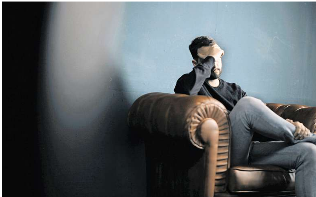
Wer sich in einer psychischen Notlage befindet und eine Behandlung benötigt, braucht Geduld.

Konkret wollen die Kassen die Psychotherapeutinnen und Psychotherapeuten gesetzlich dazu verpflichten, freie Behandlungskapazitäten an die Terminser-