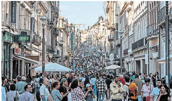
In Porto kann es in der Hauptsaison sehr voll werden.

Florenz gilt als kulturelles Highlight – aber wer in den Sommermonaten durch die Altstadt schlendert, merkt schnell: Ruhe findet man hier nicht. Mit dem höchsten Lärmpegel (durchschnittlich 60 Dezibel) unter den untersuchten Städten sowie über 2000 Hotels im Stadtgebiet ist Reizüberflutung vorprogrammiert. Wer Erholung sucht, sollte lieber in die knapp 100 Kilo-