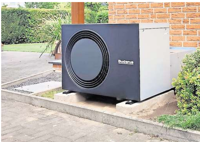
Wann macht der Einbau einen Sinn? Wärmepumpen sind ein wichtiger Bestandteil der Energiewende.

Viele Interessierte sind sich jedoch unsicher, unter welchen Bedingungen der Einsatz von Wärmepumpen gelingt und welche Maßnahmen am und im Gebäude gegebenenfalls noch nötig