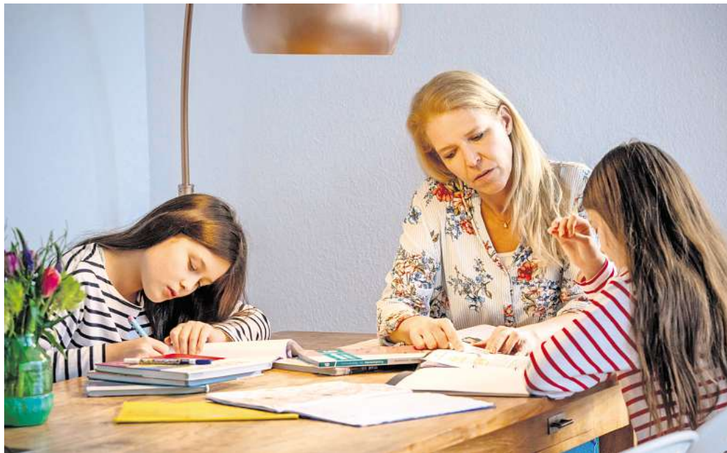
Hausaufgabenhilfe: Väter denken, die Verantwortung bei schulischen Themen sei gleich verteilt, Mütter sehen das anders.

Laut der Yougov-Umfrage hat mehr als jede zweite Frau (58