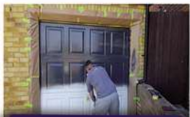
Garagen Tore streichen

Wir pflastern: Einfahrten - Gehwege - Terrassen - Stellplätze, usw. Die kleinen Kunstwerke im Pflasterbau bereiten Gästen und Passanten Freude. Pflasterarbeiten im Landschafts- & Straßenbau sind individuell und schaffen ein harmonisches Bild.