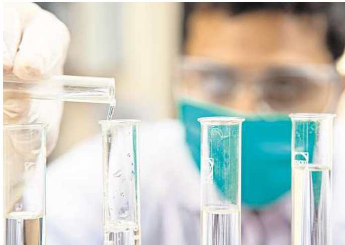
Industrie-Chemikalien, die in die Umwelt gelangen, machen uns krank und zerstören Ökosysteme.

Pestizide könnten sich ähnlich stark auf die Krebsraten auswirken wie das Rauchen – sie würden mit Leukämie, dem Non-Hodgkin's Lymphom, Blasen-, Darm- und Leberkrebs in Verbindung gebracht, schreiben die Autorinnen und Autoren des Reports. Wenn Kinder vor ihrer Geburt Pestiziden ausgesetzt seien, steige dadurch das Risiko für Leukämie im Kindesalter und Lymphome um mehr als 50 Prozent.