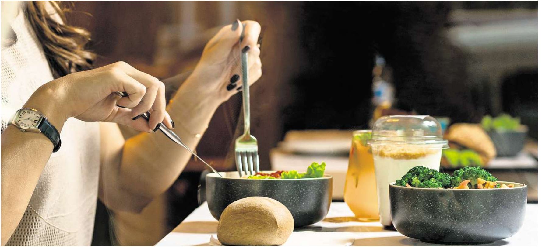
Essen soll Freude machen und die Sinne anregen.