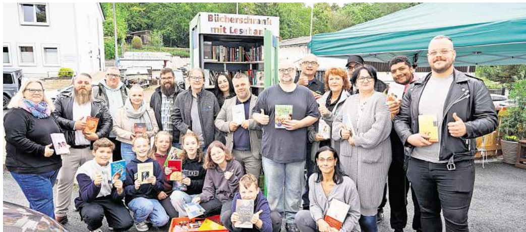
Alte Telefonzelle mit neuer Funktion: Der Bücherschrank mit Lesebank ist ein Geschenk der Wohnbau an den Verein „Salzgitter verliebt“ in Gebhardshagen.

Die WEVG Salzgitter renovierte die Schießbahn der Schützengesellschaft in Gebhardshagen und strich die Holzfassaden im Außenbereich. Mit Pinsel und Farbe machten die Führungskräfte deutlich, dass soziales Engagement nicht am Schreibtisch endet. Die Wohnbau Salzgitter schenkte dem neu gegründeten Verein „Salzgitter verliebt e.V.“ in Gebhardshagen eine umgebaute Telefonzelle als öffentlichen Bücherschrank mit Lesebank. Die Klasse 6a der Realschule Geb-