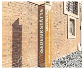
Eine Gefahr für die Demokratie: Mit dem Mythos von Verschwörungsideologien befasst sich ein Vortragsabend in der Gedenkstätte.

Thema Verschwörungsmethoden und Verschwörungsideologien mithilfe historischer, theoretischer und praktischer Zugänge in vielfältiger Weise beleuchtet und anhand von Praxisbeispielen aus der RIAS-Arbeit veranschaulicht. Eine schriftliche Anmeldung ist für die Teilnahme verpflichtend und möglich per E-Mail an info@gedenkstaette-salzgitter.de . Der Zugang erfolgt über das Tor 1 zum Stahlwerk der Salzgitter AG in der Eisenhüttenstraße in Watenstedt.