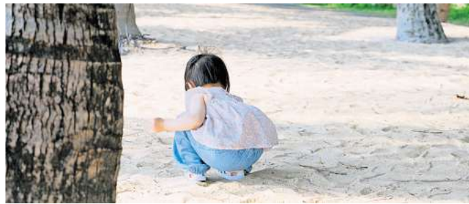
Erwachsene sind für den Schutz ihrer Kinder verantwortlich.

Für Kinder macht es keinen Unterschied, ob ich nun über Sex spreche oder über Bäume oder über Autos oder sexualisierte Gewalt. Das ist ein