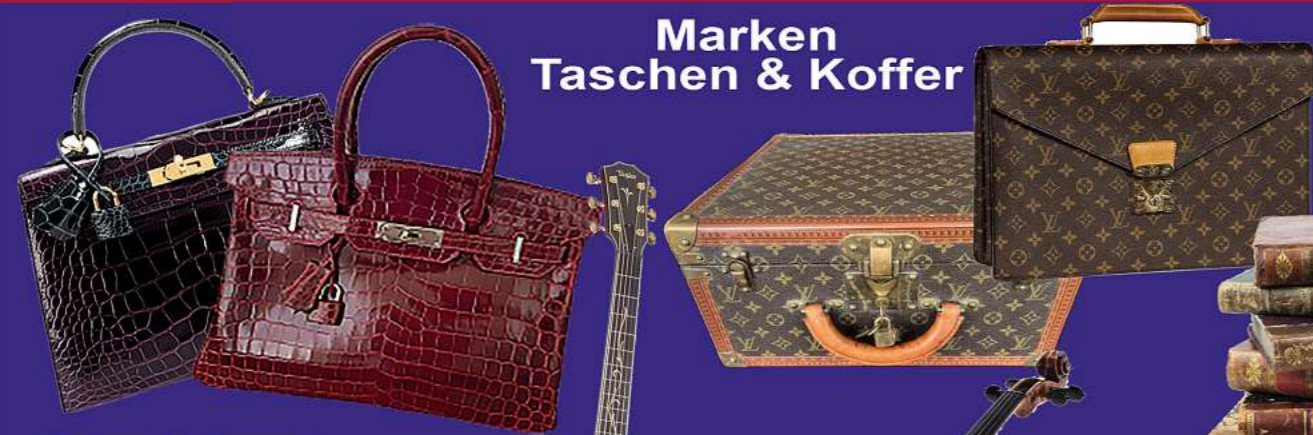
Marken Taschen & Koffer

Hauptsitz: Harztorplatz 4, 38300 Wolfenbüttel