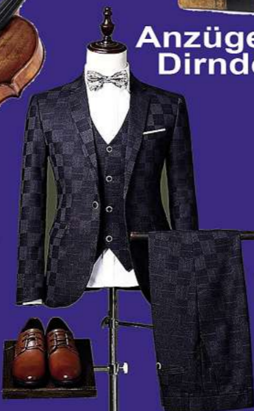
Anzüge & Dirndel