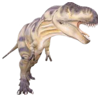
Die Dinos zaubern eine außergewöhnliche Stimmung in Salzgitters Stadt.

Laternen-Aktion: Alle Kinder, die Light the Night am Eröffnungsabend mit einer Dinosaurier-Laterne besuchen, werden am Monumentenplatz zwischen 17 und 19 Uhr.