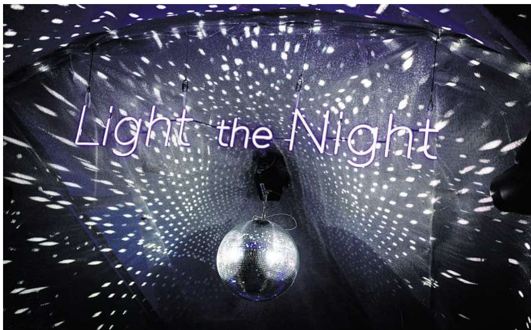
Schon zum dritten Mal gibt es das Lichterspektakel in Salzgitter.