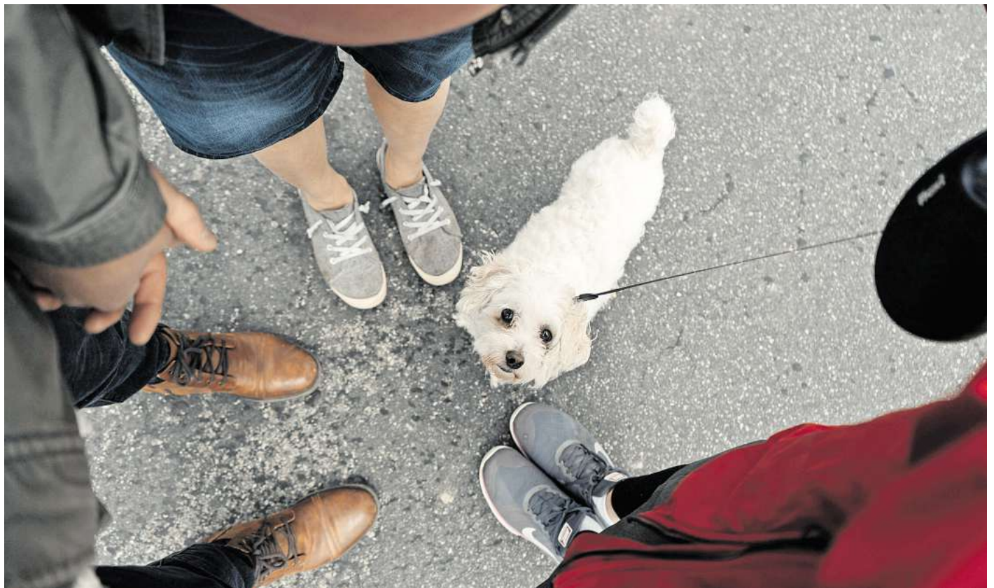
Vielen Halter empfinden das Leben mit Hund belastender als erwartet.

Vielen Eltern und Kindern macht die Haltung eines Hundes demnach Freude. Viele Halter gaben an, dass ihr Hund die psychische Gesundheit ihrer Kinder fördert – und Kinder berichteten, dass sie durch den Hund Trost und Freude empfinden. „Hunde wurden als Spielkameraden, Ersatzgeschwister oder sogar Wurfgeschwister bezeichnet“, heißt es in der Analyse.