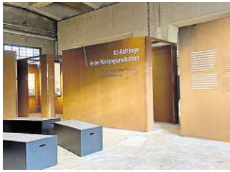
Der Arbeitskreis Stadtgeschichte lädt zum Vortragsabend in die Gedenkstätte KZ Drütte ein.

Salzgitter. Mit der „Behindertenfeindlichkeit – (nicht nur) am rechten Rand“ befasst sich ein Vortrag, den der Arbeitskreis Stadtgeschichte am Dienstag, 4. November, von 17 bis 19 Uhr in der Gedenkstätte KZ Drütte ausrichtet. Dabei geht es um „Kontinuitäten im sozialdarwinistischen Denken“, heißt es in der Ankündigung. Der Zugang erfolgt über das Tor 1 der Salzgitter AG in Watenstedt