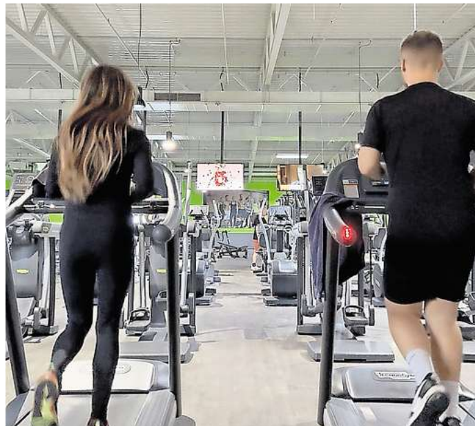
Ein idealer Ort für die November-Challenge: Auch jeder Kilometer auf dem Laufband wird gezählt.

Ganz wichtig: Es kann nur ein Bild gesendet werden pro Person. Der Läufer oder die Läuferin