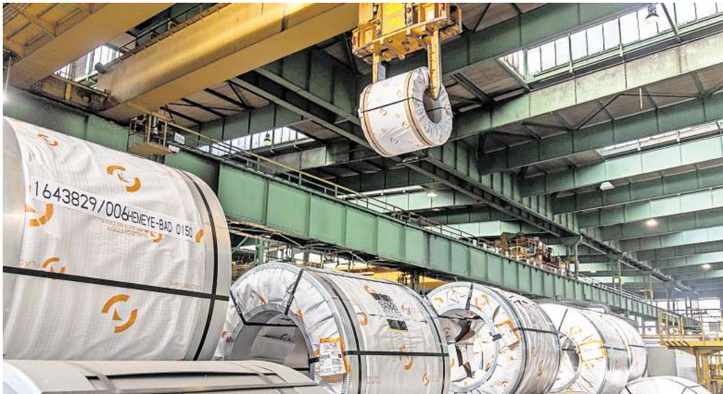
Laut Salzgitter AG birgt 2026 Potential für eine verbesserte Ergebnisperformance: Der Konzern plant eigene Programme, erwartet handelspolitische Maßnahmen und eine konjunkturelle Erholung.

Der Geschäftsbereich Handel habe den im zweiten Quartal eingeleiteten Turnaround dank Kostenanpassungen und Restrukturierungsmaßnahmen verstetigen können, während das Segment Stahlerzeugung ein ausgeglichenes Quartalsergebnis erzielte, heißt es in einer Pressemitteilung. „Weiterhin hohe Importmengen sowie ein anhaltend starker Wettbewerbsdruck durch die fortgesetzte Nutzung preisgünstiger russischer Brammen in der EU belas-