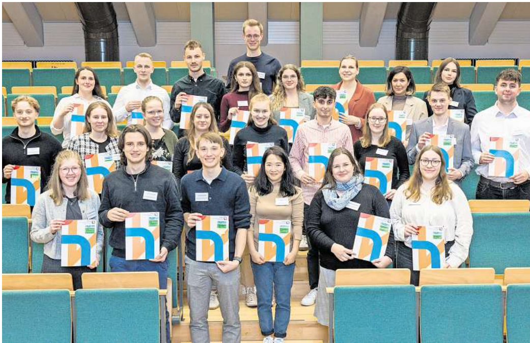
Aus allen vier Standorten der Ostfalia Hochschule: Die Studierenden, die mit dem Deutschlandstipendium unterstützt werden, stammen aus Wolfenbüttel, Wolfsburg, Salzgitter und Suderburg.