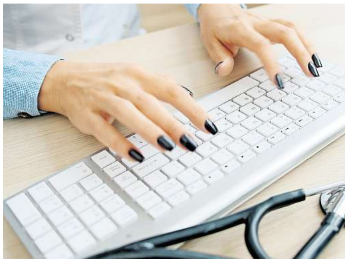
Die absolute Sicherheit gibt es nicht: Am 1. Oktober 2025 wurde die elektronische Patientenakte (ePA) eingeführt.