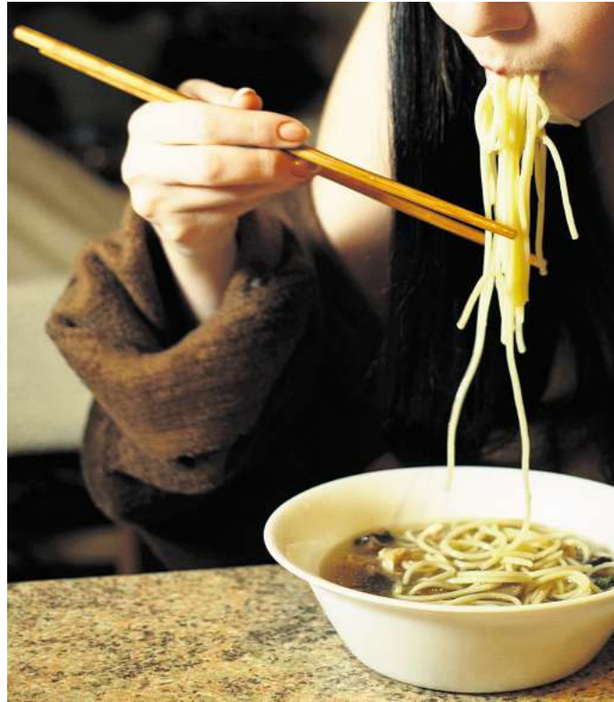
Hara hachi bu steht für achtsames und bewusstes Essverhalten.

Doch häufig verpassen wir diesen Zeitpunkt – aus verschiedenen Gründen. Weil wir zu emotionalem Essen neigen, gerade wenn wir gestresst sind. Hinzu kommt ein Überangebot an Essen, auch auf den Tellern. Die Portionen seien zum Teil so groß, dass es schwerfalle, sich an die 80-Prozent-Grenze zu halten. Außerdem neigen wir dazu, zu schnell zu essen. „Wer zu schnell isst, kann eher die hormonellen Signale verpassen“, sagt die Ernährungsberaterin. Und: Oft essen wir mit Ablenkungen – seien es Smartphones oder Zeitungen, die uns am Küchentisch Gesellschaft leisten. Dieses Verhalten wird mit einer höheren Kalorienaufnahme,