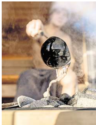
Ganz viele Unterschiede: Ein Besuch in der Sauna in Finnland hat nur wenig mit dem Gehabe in Deutschland zu tun.

Wenn man in einer deutschen Sauna auf der untersten Ebene sitzt, hat man die Steine oft auf Kopfhöhe. Dann hast du kalte Füße und einen heißen Kopf. Oft ist das ein Temperaturunterschied von 25 Grad und mehr. Das macht gar keinen Sinn, und deutsche Saunen sind viel zu hoch konstruiert: Wenn man unten sitzt, hat man noch zwei, drei, vier Meter Luft über dem