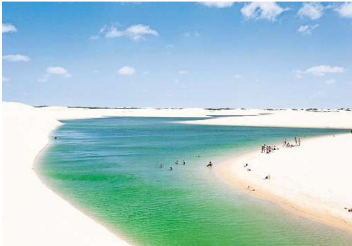
Dünen und mit Regenwasser gefüllte Täler in Brasiliens einziger Wüste.

Die Winde in der Region formen aus dem weißen Sand ein riesiges Feld von Sicheldünen – halbmondförmige Sandanhäufungen, in kilometerlangen Ketten aneinandergereiht. Manche von ihnen