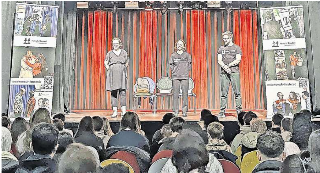
Großes Interesse: In der Kulturscheune standen die Themen Rassismus, Vorurteile und Fremdenhass im Mittelpunkt der Aufführung.

Das Team Jugend- und Demokratiebildung der Stadt blickt zurück auf 2025