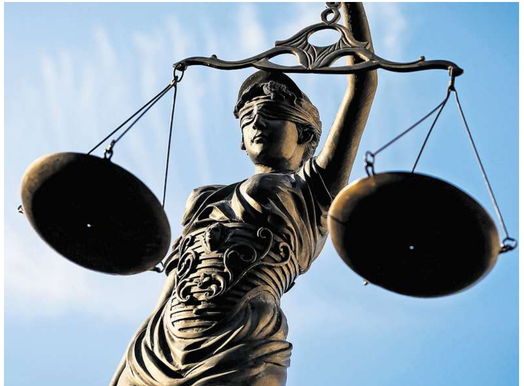
Ein Gericht wertete das bewusste Verschweigen von Einkommen durch das Kind als sittenwidrig: In solchen Fällen droht die Rückzahlung zu Unrecht erhaltener Unterhaltsleistungen.

Allerdings beschränkten die Richter den Rückzahlungsanspruch auf 19 Monate. Denn spätestens ab dem mutmaßlichen Ende der Regelstudienzeit (drei Jahre Bachelor, zwei Jahre Master) hätte sich dem Vater aufdrängen müssen, selbst nach dem Status des Studiums und der finanziellen Lage seines inzwischen fast 30-jährigen Sohnes zu fragen. Da er dies unterließ, entfiel ab diesem Zeitpunkt die Informationspflicht des Sohnes und wurde vom Gericht nicht mehr als „sittenwidrig“ angesehen, da sich die Versäumnisse beider Parteien ab da die Waage hielten. (DPA)