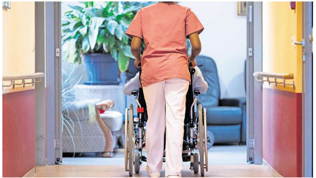
Wohngeld, Pflegewohngeld, Hilfe zur Pflege: Wird das Geld knapp, können Pflegebedürftige im Heim Unterstützung bekommen.

Zudem gibt es in drei Bundesländern – Nordrhein-Westfalen, Schleswig-Holstein und Mecklenburg-Vorpommern – das Pflegewohngeld als zusätzliche Unterstützung. „Wenn