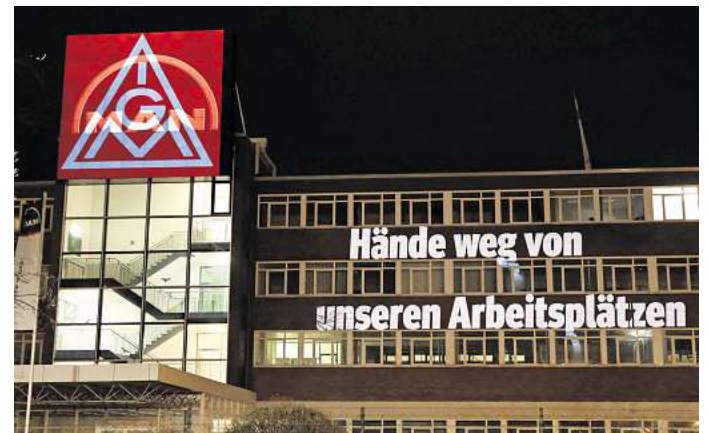
Die Proteste der Beschäftigten hatten Erfolg: Die IG Metall meldet eine langfristige Sicherung des MAN-Standortes in Salzgitter.

„Es war unser Ziel, für Salzgitter die gleichen Sicherheiten zu