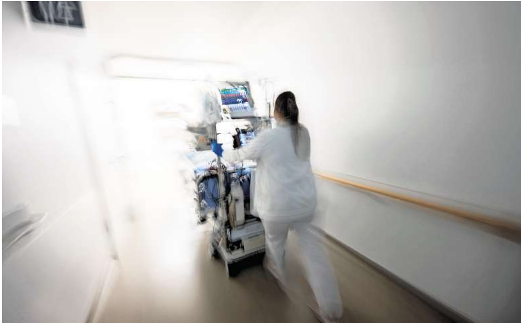
Kliniken sind dazu verpflichtet, leicht erreichbare Beschwerdestellen einzurichten.

Und wenn nicht? Dann macht man sich am besten schlau, wohin man sich im Krankenhaus wenden kann.