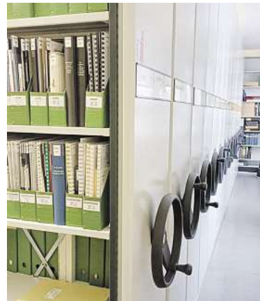
Ein Blick ins Stadtarchiv: In Rollregalen sammelt die Behörde wichtige Akten.

Wer gern zur eigenen Familie forschen möchte, erhält im Stadtarchiv Tipps und Hilfestellung dazu. Die Gäste können erfahren, wie der Start in die eigene Familienforschung aussehen kann und welche Unterlagen dazu im Stadtarchiv aufbewahrt werden.