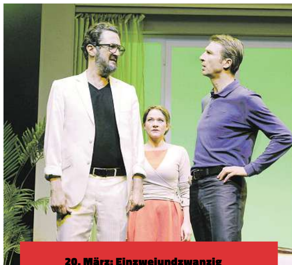
20. März: Ein-zwei-und-zwanzig vor dem Ende.

Zwischen den beiden Herren entspinnt sich ein aberwitziger Dialog um den Freitag und den Möchtegern-Mörder, der nicht nur ein Erfüllungsgeliebter des Todes ist, sondern sich auch noch in der Tür geirrt hat. Eigentlich ist eine Nachbarin